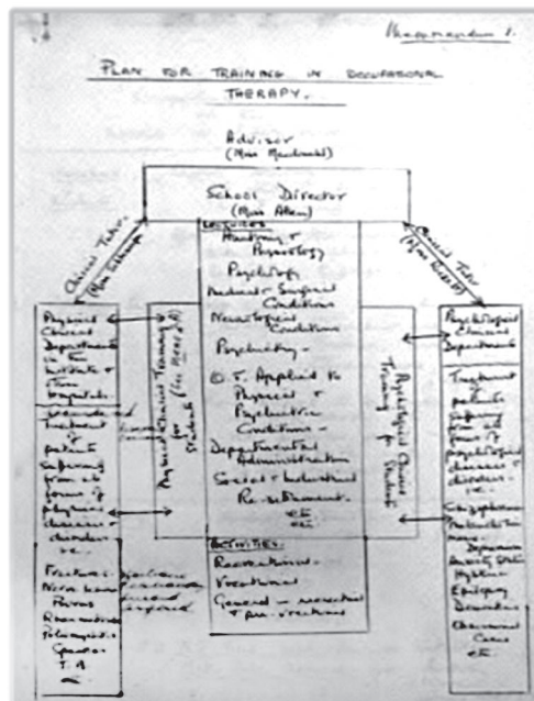
Figura 2. Manuscrito del plan de formación de la ENTO, 1959.