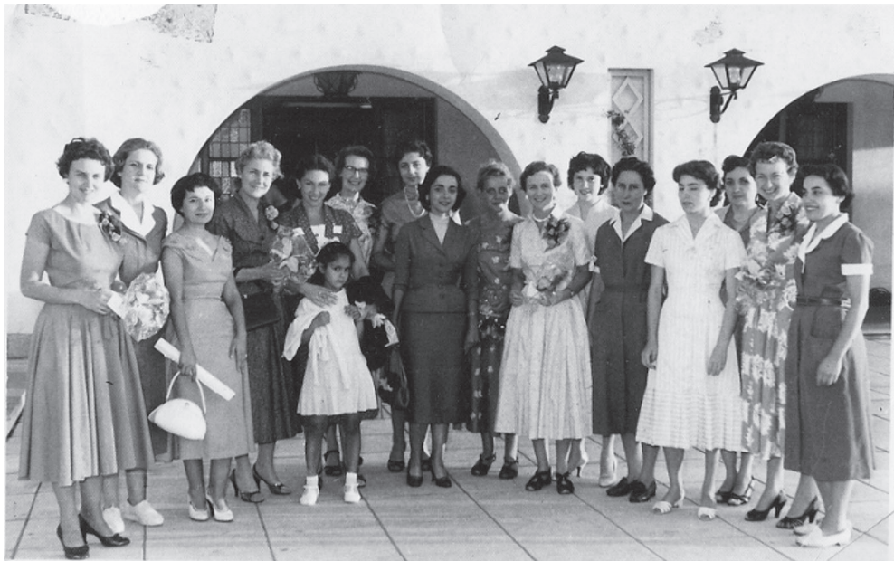
Foto: Archivo digital de las investigaciones llevadas a cabo por los autores. Año 1956 (probable).